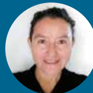
Redacción Viviana Galván